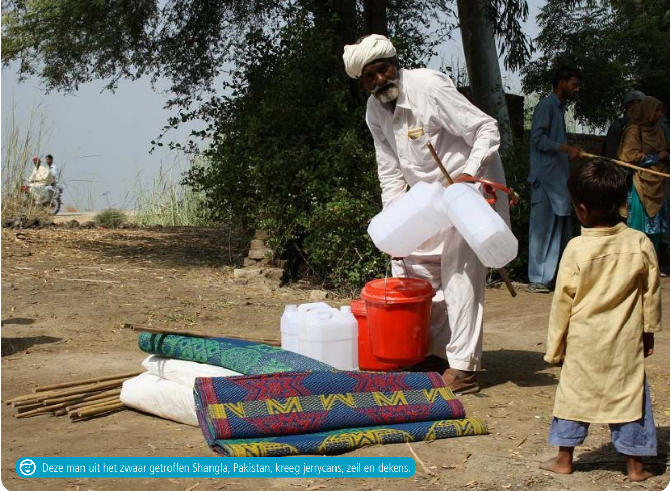
Deze man uit het zwaar getroffen Shangla, Pakistan, kreeg jerrycans, zeil en dekens.

Vier mobiele klinieken bemand door een arts, een apotheker, een verpleegkundige en een chauffeur hebben medische hulp verleend in Shangla, in het noorden van Pakistan. Ze deelden gratis medicijnen en toiletartikelen uit om de uitbraak van ziektes te voorkomen. Samen met andere hulporganisaties is aan 21.000 mensen medische zorg verleend, kregen 800 mensen gezondheidsvoorlichting, 300 gezinnen kregen toiletartikelen en voorlichting over hygiëne en werden 6.000 mensen voorzien van dekens, plastic zeil en kookpullen. ☺